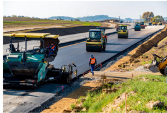
L'activité de travaux publics a baissé de 15% en 2020 en Occitanie

Après une baisse d'activité de 15% en 2020, la filière des Travaux publics en Occitanie s'attend à un premier semestre tout aussi compliqué. Pour éviter les licenciements, elle demande aux collectivités de maintenir et accélérer la commande publique.