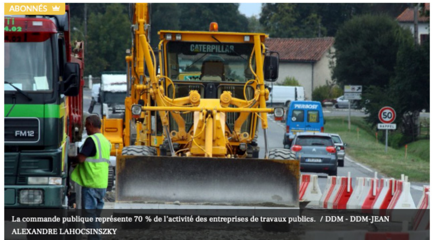
La commande publique représente 70 % de l'activité des entreprises de travaux publics.